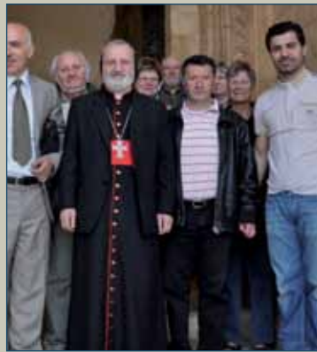
christelijke minderheden in het Midden-Oosten